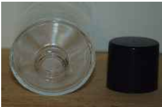
Détail des flacons à grosse ouverture.

Nous conditionnons désormais pratiquement toute la gamme en 30 ml en verre brun, sauf les huiles essentielles trop coûteuses ou rares.